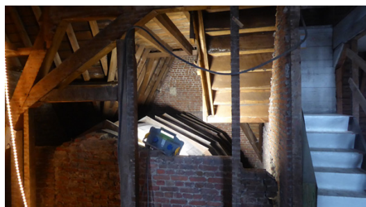
Restauratie Huis Janssens