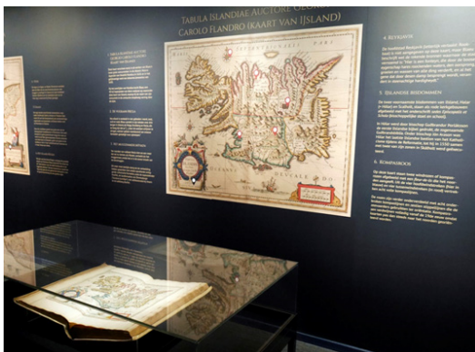
Bleau-tentoonstelling in Mercatormuseum

Graag hadden wij uw e-mail- adres ontvangen op info@kokw.be , zodat u voortaan deze nieuwsbrief digitaal kan ontvangen. Bedankt hiervoor.