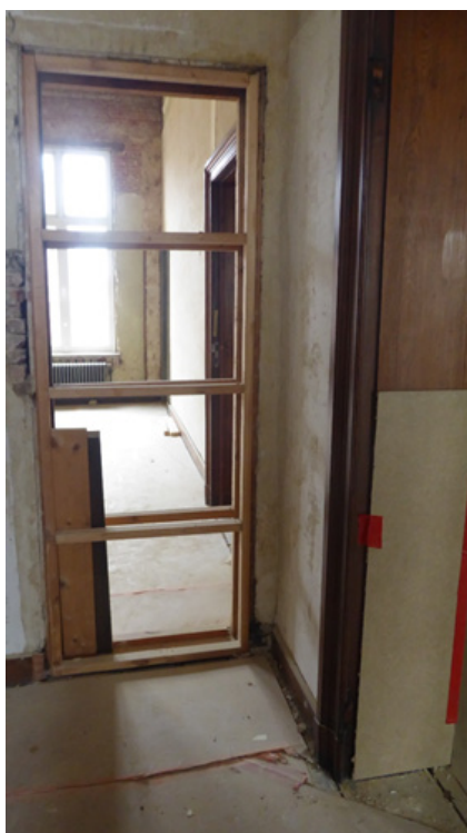
Links het "grote gat" in de inkomhal, rechts één van de twee ontdekte deuropeningen